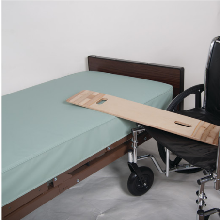
Planche de transfert bariatrique avec trous pour les mains